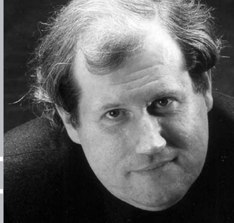
ARTISTS MANAGEMENT COMPANY