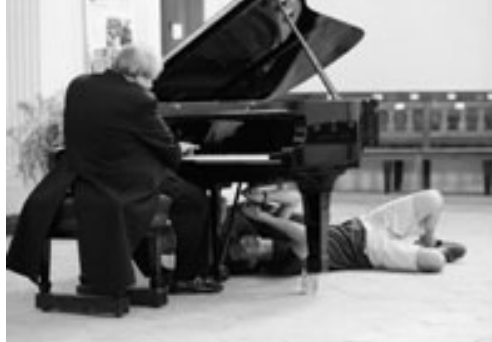
Grigori Sokolov schätzt den vollen Einsatz der Steinway-Techniker.

Klavierunterricht beginnen. Als ich das Klavier bekommen habe, habe ich meinen Traum zu dirigieren sofort vergessen und wollte nur mehr Pianist sein. Viele Instrumentalisten beginnen später zu dirigieren, bei mir war es umgekehrt, ich habe es mit vier Jahren schon erlebt.